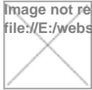
Image not readable or empty file:///E:/webs/maria-de-huerva/sites/default/files/sites/default/files/feria_medieval_2012.png